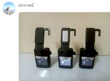
บันทึก | บันทึกเป็น... | แอปฯ | ส่งไปยัง Keep Memo

ปราการณ์ เด่นชัย ใช้การได้ 3 เครื่อง 7.17 น.