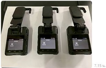
บันทึก | บันทึกเป็น... | แอปฯ | ส่งไปยัง Keep Memo

09/สส.สุพรรณ อุตรดิตถ์ 3 ครบครับ 7.15 น.