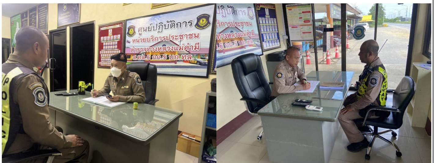
มอบนโยบายให้เจ้าหน้าที่ทุกหน่วยบริการกวดขันจับกุม ตรวจสอบรถบรรทุกน้ำหนักเกินอย่างต่อเนื่องและจริงจัง